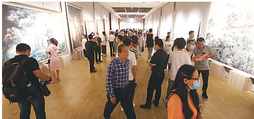
“海南省历史文化重大题材美术创作工程作品展”在省博物馆开展。