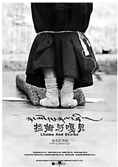
藏语片 《拉姆与嘎贝》 主演现身三亚