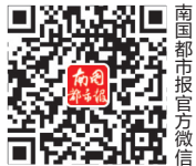
南国都市报官方微信

南国都市报10月8日讯(记者王燕珍)2019年是南国都市报创刊19周年,10月8日起,南国都市报启动19周年读者节系列活动,邀请每一位读者共同参与。与此同时,也将邀请每一位读者,讲讲你与南国都市报的故事,讲讲19年里的人、情、事、理。活动启动当天,就吸引了多位本报的铁杆读者来电,讲述他们与南国报的故事。