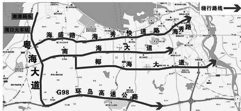
图1:绕行线路。

滨海大道(粤海大道与滨海大道交叉路口以东至四二四路口);玉兰路、民生路、世贸北路、红棉路等万绿园西侧路段;玉沙路、世贸东路、金贸中路、金贸西路、明珠路、国贸大道、金龙路等国兴大道、世贸路段;龙昆北路、世纪大桥、滨海立交桥、海甸西西路、人民大道、碧海大道、白沙门公园门前路段等。