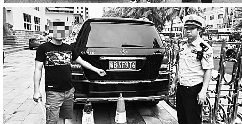
2辆奔驰车涉嫌套牌被海口交警查获

南国都市报6月11日讯(记者 王燕珍 特约记者 陈世清 通讯员 钟玲)6月11日,海口公安交警对2辆涉嫌套牌的奔驰车进行曝光,希望驾驶员引以为戒。