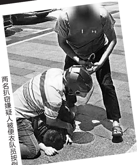
两名扒窃嫌疑人被便衣队员按倒