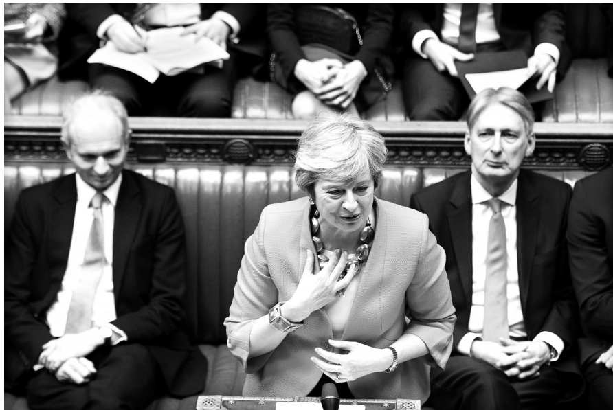
3月12日，在英国伦敦，英国首相特雷莎·梅出席议会下院辩论。

特雷莎·梅和欧盟委员会主席让-克洛德·容克11日晚磋商后宣布，英国和欧盟约定对“脱欧”协议作具有法律约束力的补充，以确保英国不会因“备份安排”滞留欧盟。不过，英国检察总长杰弗里·考克斯说，修订后的“脱欧”协议降低、但没有消除英国受制于欧洲关税同盟的风险；特雷莎·梅的盟友北爱尔兰民主统一党说，英欧没有就边界事宜取得“足够进展”。