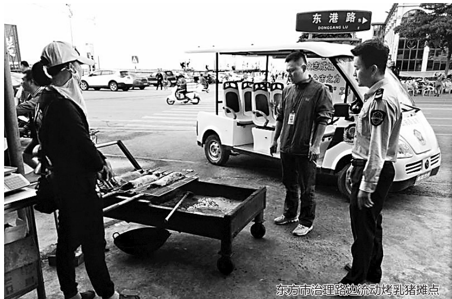
东方市治理路边流动烤乳猪摊点

烤乳猪作为一道地方特色美食,深受居民和游客的喜爱。为切实保障广大人民群众舌尖上的安全,东方市食药监局结合市“三创”工作要求对全市范围内经营烤乳猪的餐饮单位进行检查,进一步规范经营行为。