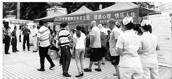
10日,我省举行“世界精神卫生日”宣传活动。