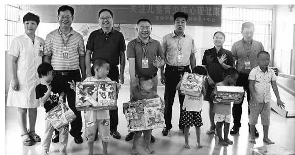
10月10日,省安宁医院相关领导陪同省卫生健康委领导,到该院儿康科探望孤独症儿童。

据悉,省安宁医院作为全省的精神卫生中心,积极指导全省各县市精防机构开展群众喜闻乐见的宣传活动,加强与新闻媒体的协调沟通,做好相关活动的系列宣传报道工作,增进社会对精神障碍患者的理解与关爱。(洪旭/文)