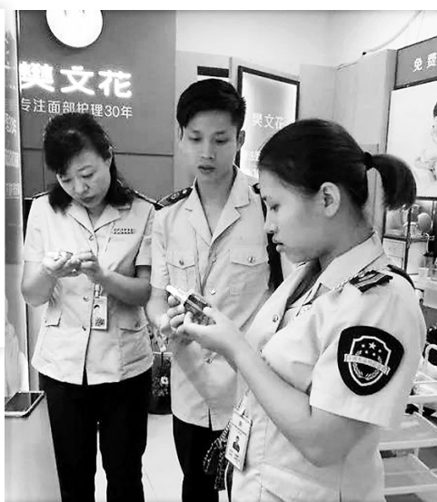
右图:秀英区食药监局执法人员对辖区内的化妆品经营单位进行检查。

相同的过期产品。经初步审查,当事人销售过期的屈臣氏骨胶原水盈保湿凝霜,该行为涉嫌违反了《化妆品卫生监督条例》的相关规定,对此,秀英区食药监局对上述2盒化妆品予以查扣并立案调查。