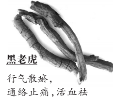
黑老虎 行气散瘀,通络止痛,活血祛瘀

缩;肾主骨,如果虚就不能养骨,风寒湿邪便可趁虚而入。因此,中医调理风湿骨病大多从疏肝、健脾、补肾入手。常见中药有滋肾的牛大力,《中药大辞典》573页记载,它能舒筋活络,壮筋骨;《全国中草药汇编卷三》274页中的红杜仲、归肝经,能舒筋活络,适用于风湿痹痛、腰膝冷痛、筋骨疼痛等疾病。 部分内容参考39健康网