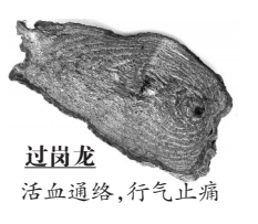
过岗龙 活血通络,行气止痛