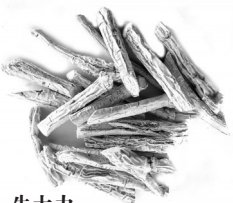
牛大力 舒筋活络,壮筋骨