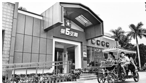
万绿园第五空间，能如厕能取钱存钱还能上网。