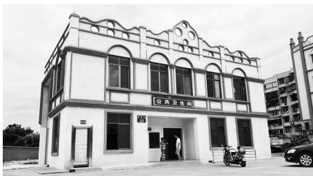
金牛路上的“三位一体”公厕，具有多种功能。