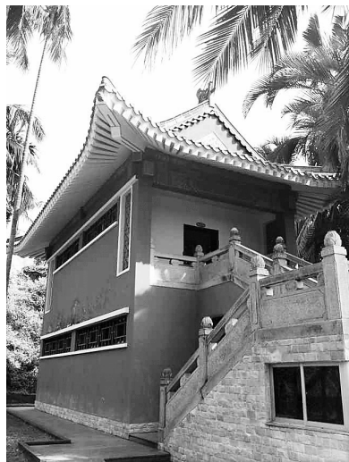
五公祠景区内厕所，与古建筑融为一体。