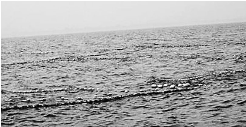
翁田海域可见浮标,有人布下定置网捕鱼。