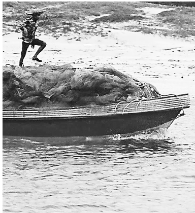
龙楼海域,有渔民在非法捕鱼。