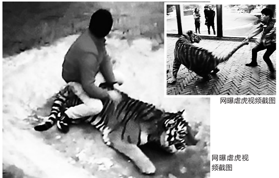
网曝虐虎视频截图