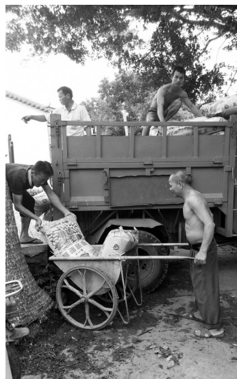
当地农户正在领取免费肥料。

南国都市报7月21日讯(记者 胡诚勇)政府免费发放的肥料,居然成了海口市红旗镇一家私营农资店用来卖种子搞促销的赠品,这件荒唐事于7月20日经南国都市报曝光后,引起了有关部门的高度重视,目前,多个相关部门已介入调查。与此同时,海口市农业技术推广中心也及时采取整改措施,将之前暂时存放在该农资店仓库内的肥料按计划全部发放到农户手中。