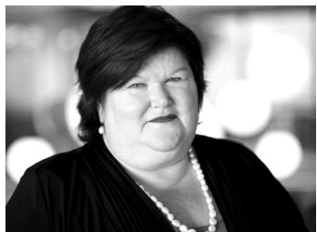
卫生部长德布洛克体重127公斤