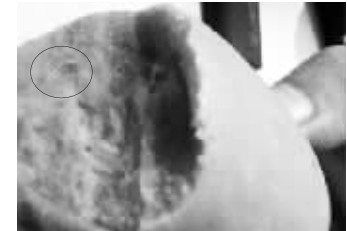
火腿肠中发现蛆虫

由于双方对此存在争议,工商执法人员便将所有火腿肠带回工商所。当天下午5点左右,记者前往黄村工商所了解情况。工作人员将火腿肠从存放文件物品的柜子中取出,大家意外发现,原本剥开后没有问题的四五根火腿肠,此时却都爬满了形态一致的白色蛆虫,且不断蠕动。这袋火腿肠的生产日期为2012年5月8日,保质期6个月。