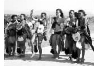
斯威士兰的选妃场景(资料图)

据《环球邮报》5月6日报道，拥有13位妻子的斯威士兰国王姆斯瓦蒂三世最近再次陷入婚姻危机，其第六王妃德拉米妮于6日逃离皇宫，声称姆斯瓦蒂三世在身体上和精神上对她实行了长达数年虐待。