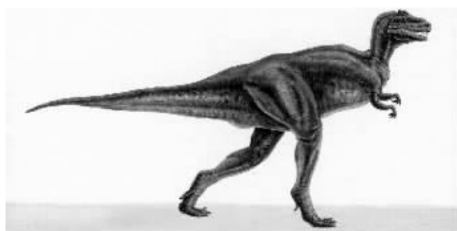
恐龙成了气候变暖的“罪魁祸首”

英国科学家近日研究发现，恐龙排出的胃胀气可能是造成中生代(距今约2.5亿年-6500万年)气候变暖的原因之一。