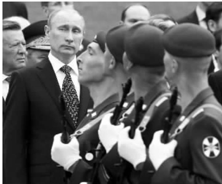
5月8日，俄罗斯总统普京来到莫斯科克里姆林宫红墙外的亚历山大花园，向无名烈士墓敬献花圈，悼念在卫国战争中英勇牺牲的将士们

普京在当日签署的外交法令中称，俄有意致力于改善俄美关系，使之转向战略层面的双边合作，但不容许美干涉俄内政，且重申，要求美国就导弹防御不针对俄罗斯提供切实的保障。(中新)