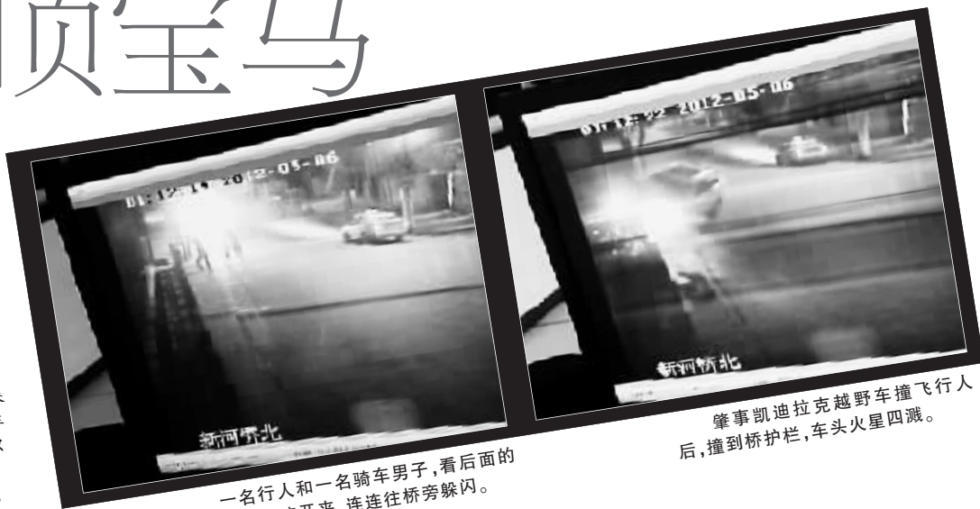
一名行人和一名骑车男子,看后面的车子飞速开来,连连往桥旁躲闪。

深夜,温州平阳鳌江镇新河南路,一阵汽车马达轰鸣声,打破了这里的平静。轰鸣声来自一辆凯迪拉克越野车,它顶着一辆宝马轿车,疯狂地向前开去。开出50米后,宝马车被树挡牢,越野车还没停下,加速后,它又撞上一名行走的妇女和一名骑车的男子,撞塌10多米长桥栏。住在附近的居民赶到现场,只看到被撞伤的男子,还有一只女鞋。最终,人们在桥下的河里,找到了一名女子,她已经身亡。7日下午,平阳警方介绍,案发后,他们已成立了专案组调查,目前正全力侦破此案。