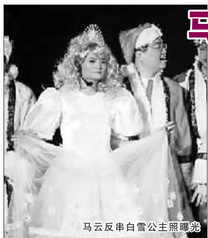
马云反串白雪公主照曝光