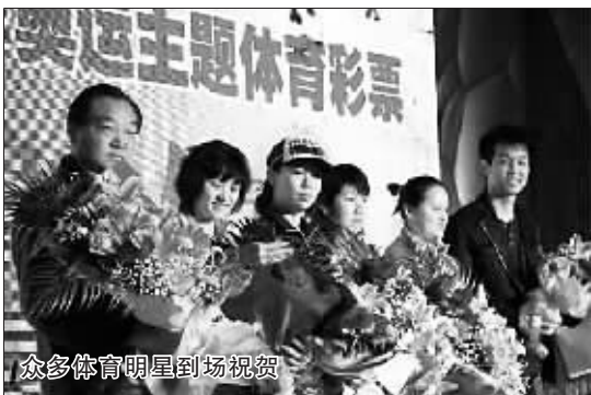
众多体育明星到场祝贺