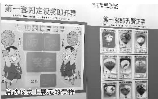
启动仪式上展示的票样

本报北京3月23日电(本报记者徐伟东摄影报道)经财政部批准,国家体育总局彩票管理中心推出以奥运为主题的系列提议彩票,23日,在离北京奥运会开幕还有138天的时候,国家体彩中心在京举行盛大的奥运主题体育彩票启动仪式。